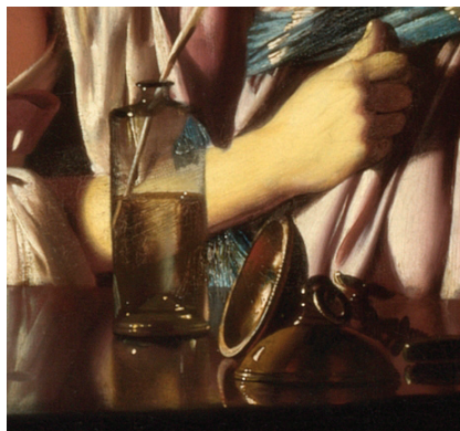
Figura 3: Detalhes do vaso no centro do quadro, por trás do qual provém a luz que ilumina todo o quadro (esquerda) e detalhes de um frasco com líquido e dos hemisférios de Magdeburgo (direita).

sentado à direita, que assume postura introspectiva em aparente atitude de oração. Ao seu lado e vizinhas à bomba de vácuo, duas meninas, consoladas por um adulto, exibem terror e consternação diante da iminente morte do pássaro.