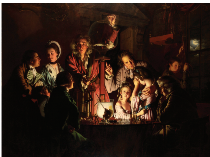
Figura 1: A obra An experiment on a bird in the air pump (Um experimento com um pássaro na bomba de ar) elaborada por Joseph Wright of Derby em 1768.

Do lado esquerdo, um adulto e uma criança encontram-se totalmente envolvidos pelo experimento. O adulto está sentado, tem em suas mãos um relógio e parece verificar o tempo que o pássaro suporta sem ar. Essa representação é carregada de significado. Nos quadros medievais, as referências ao tempo (traduzidas principalmente pela presença de ampulhetas ou de crânios) eram feitas muitas vezes no sentido de lembrar ao homem a finitude da vida e a inevitabilidade da morte, sobre a qual não se tem domínio. O relógio exhibe aqui, além do significado acima, um status epistemológico diferente, em que o tempo aparece também como coordenada física a ser utilizada no experimento, algo que podia ser representado matematicamente e que já fazia parte da interpretação mecânica do mundo no século XVIII. A presença do adulto com o relógio se contrapõe ao homem