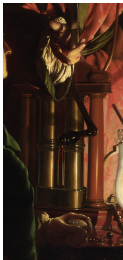
Figura 2: Detalhes de James Ferguson, do balão contendo o pássaro (esquerda) e da bomba de vácuo (direita).