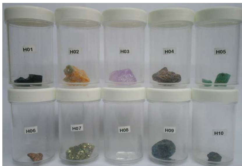
Figura 4: Exemplo de kit com minerais desconhecidos que devem ser identificados pelos grupos de alunos.

Os critérios para as análises das amostras minerais, que foram realizadas pelos grupos de alunos, foram