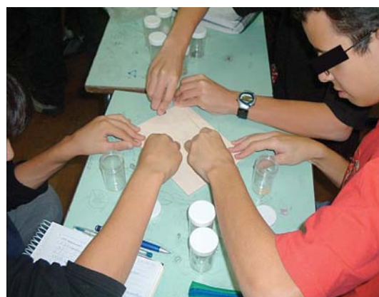
Figura 5: Grupo trabalhando na determinação do traço dos minerais.

Conforme descrito na seção anterior, os minerais que faziam parte dos kits foram reconhecidos pelos alunos por meio das propriedades dos minerais. Entretanto, foi necessário desenvolver com os alunos a conceituação das propriedades e dos modelos explicativos a elas relacionados. Nesse sentido, a partir da