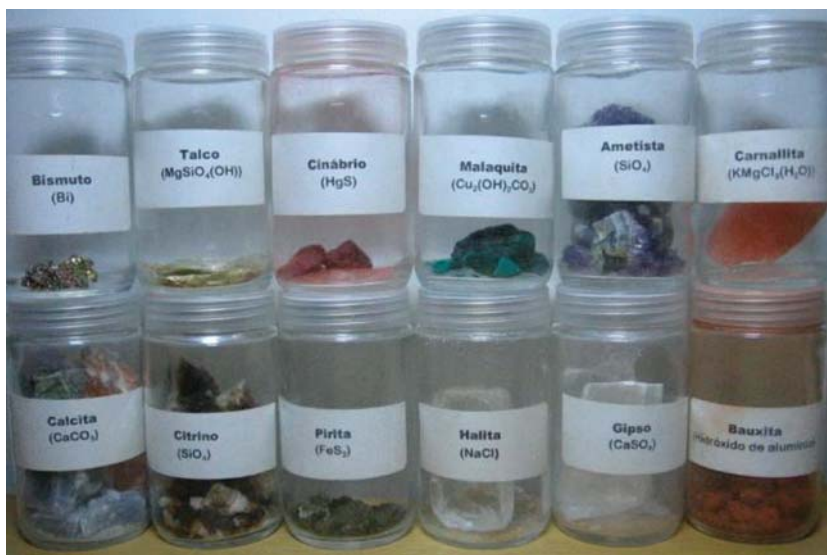
Figura 3: Algumas amostras de minerais utilizados nas atividades com os alunos.

Uma segunda tarefa com os minerais consistiu na identificação de uma pequena coleção de dez minerais. Fo-