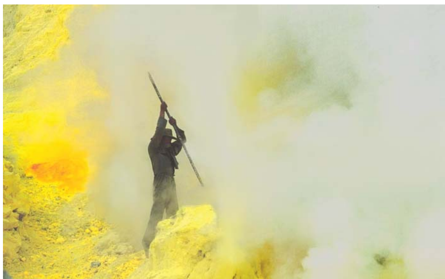
Figura 1: Trabalhador colhendo enxofre na borda do vulcão Kawah Ijen, na Indonésia.

Nesse sentido, preparou-se uma lista de cátions e ânions que deveriam conter os minerais, visando à variedade dos elementos químicos que seriam estudados no decorrer do ano letivo. Os ânions de interesse foram: carbonato, cloreto, fluoreto, fosfato, hidróxido, óxido, silicatos, sulfato e sulfeto. Os cátions de interesse foram dos metais: alumínio, bário, boro, cálcio, chumbo, cobre, estanho, ferro, mag-