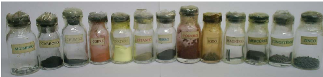
Figura 6: Kit de substâncias elementares utilizado nas atividades com os alunos.

metade do ano letivo, foram enfatizadas atividades que possibilitassem a elaboração conceitual das noções científicas necessárias à explicação das propriedades dos minerais, deixando em suspenso as atividades com o kit de minerais até o final do ano letivo.